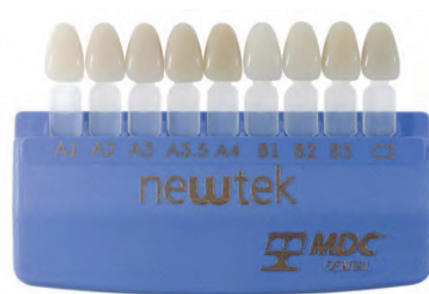
A1, A2, A3, A3.5, A4, B1, B2, B3, C2